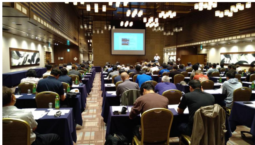
R6.7/11 長野地区部会 技術研修会