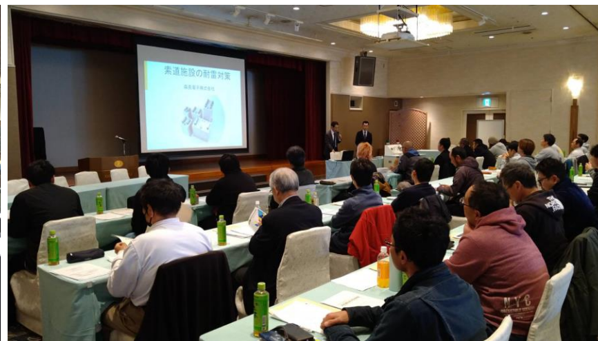
R6.11/6 長野県事業者協議会 事故防止研修会